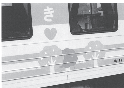
ラッピング列車(さくら)