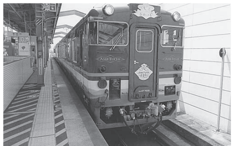
乗り入れ予定の「あめつち」

に到着してからの周遊観光や駅周辺でのお土産販売、沿線のビュースポットの整備等、多くの課題もあると感じた。