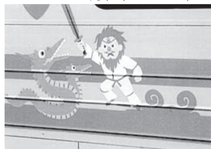
ラッピング列車(しんわ)